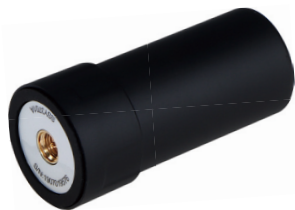
GLED-ANT-007V2 三系统七频四臂螺旋天线